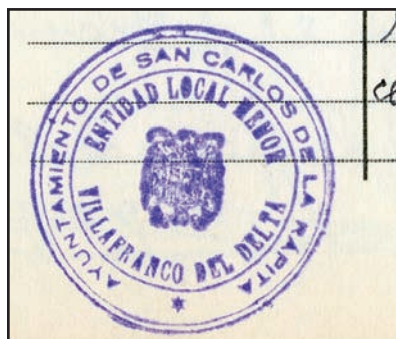
Detall del Segell de l'Entidad Local Menor de Villafranco del Delta

L' Entidad Local Menor de Villafranco del Delta es va constituir per un Decret del Ministeri de Governació del 12 d'abril de 1957 3 i la va fer dependent del Municipi de Sant Carles de la Ràpita. Amposta, que va veure com una part del seu terme era segregada i annexionada al municipi veí, va engagar un seguit de processos legals per a recuperar la jurisdicció perduda. El final del procés va comportar l'anul·lació del Decret de 1957, que es va materialitzar en un acord del Consell de ministres del 10 d'octubre de 1969 sobre la resolució del Tribunal Superior de Justícia de 14 de juny del mateix any. Aquesta resolució no va suposar cap pèrdua de territori per part de La Ràpita, com popularment es creu, sinó que es va tornar a la delimitació municipal anterior a 1957. A partir