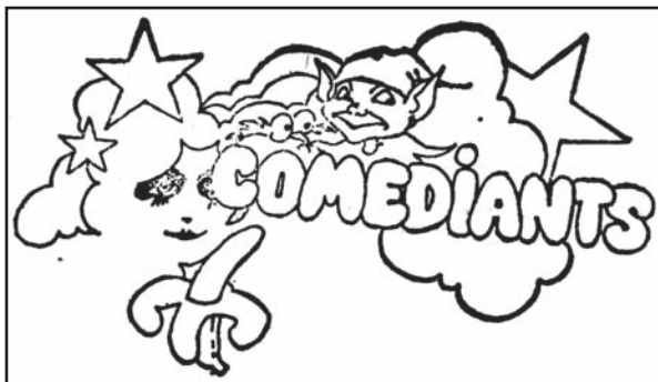
Detall de l'anagrama de la companyia de teatre Comediants que acompanyava aquell oferiment de l'any 1975

cles teatrals o d'animació infantil, a banda de l'ofertament de Comediants que protagonitza aquest document del mes, es presenten altres companyies d'escenari com ara la "Tirso de Molina" o la "Popular" o companyies líriques com "Ruperto Chapi". Comediants proposa les dues versions de l'espectacle de carrer "Catacroc!". Parlem de dues opcions, perquè, malgrat es proposa com a un espectacle infantil, també es presta per fer una versió "per a adults". Presenten l'espectacle com a festiu i alegre i per tant, perfecte per a les festes on