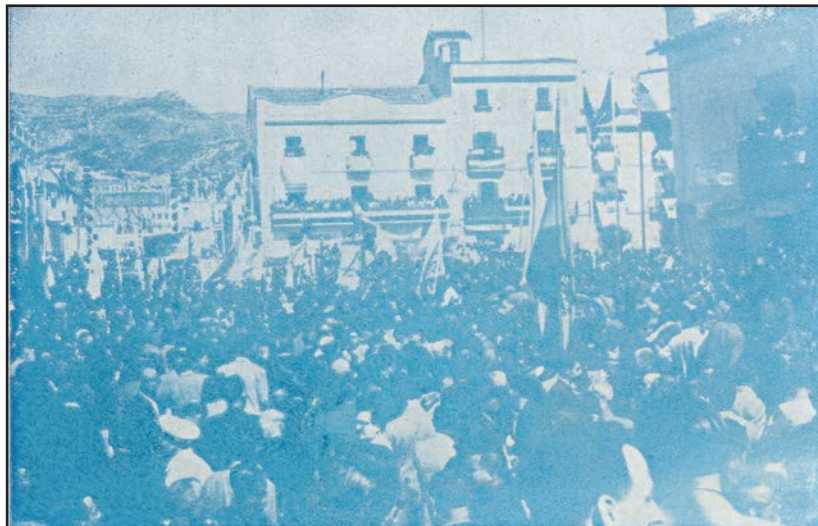
Fotografia de la Visita del Dictador Francisco Franco

I una altra proposta de recerca: si les festes se celebren el juliol és per coincidir amb Sant Jaume o amb Santa Anna? Alguna notícia trobada ens pot fer dubtar. Per exemple, mentre que la missa de les festes de 1910 es fa el dia 25 de juliol, el dia 26 es parla clarament de "Fiesta de Santa Ana" i no s'esmenta Sant Jaume per enlloc