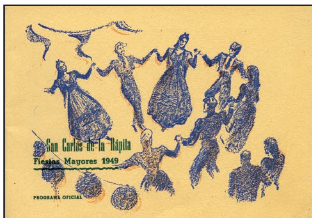
Portada del Programa de Festes de 1949

La cultura tradicional també té força presència: les referències als balls propis 5 o la participació de la dolçaina les trobem en diverses notícies 6 i també és recordat per Lluís de Montsià o per Sebastià Juan Arbó 7 . I també altres activitats culturals, socials i esportives com la representació d'obres teatrals 8 , la festa de l'arbre 9 , les curses ciclistes 10 i elements que es posen de moda a finals