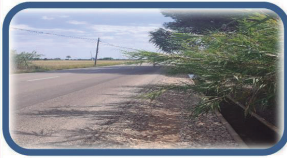
Carretera de la vergonya: si la via és prou dolenta, només cal, que les canyes envaeixen la calçada

Cada setmana intentarem publicar fotografies del mal estat en què es troba la nostra població, a les nostres xarxes social, per tal que tota la població se n'adoni i per tal d'intentar que es pugui acabar solucionant tots els problemes.